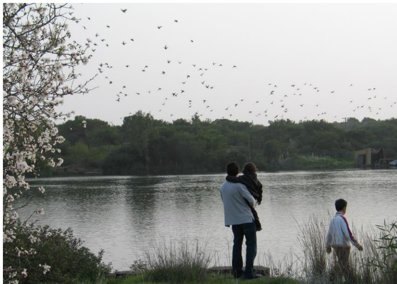
Εικ. 2: Η φύση βρίσκεται σε συνεχή σχέση με τον Δημιουργό και ο άνθρωπος είναι ο σύνδεσμος, ο ιερέας που θα διατηρήσει τη σχέση του κόσμου με τον Θεό και θα πρωτοστατήσει στον αγιασμό του (Δεσποτική Λίμνη-ΚΥΚΠΕΕ).