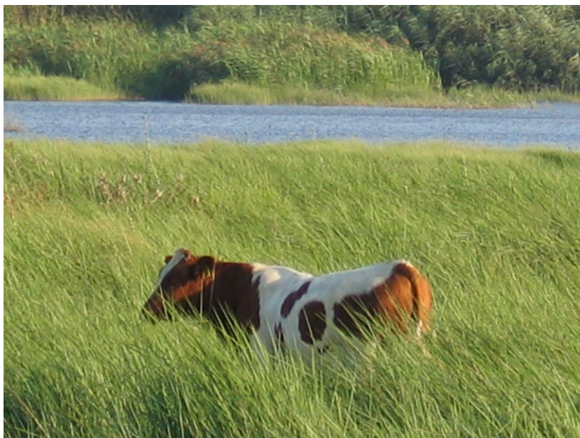
Εικ. 7: Ο σύγχρονος άνθρωπος καλείται να είναι φύλακας της γης και των οργανισμών της, φύλακας των λόγων της κτίσεως και ιδιαίτερα των ζωντανών οργανισμών.