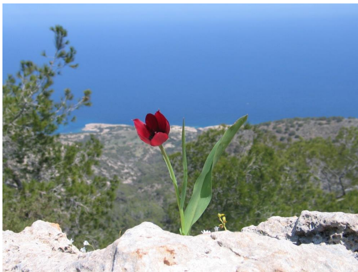
Εικ. 4: Τουλίπα η κωπρία ( Tulipa cyprica ). «Όταν αγαπήσουμε τα δέντρα, τα λουλούδια, τα άνθη, τότε η αγάπη ανεβαίνει προς τον Δημιουργό μας και έτσι πραγματικά και αληθινά Τον αγαπάμε» (Άγιος Πορφύριος Κουσοκαλυβίτης).