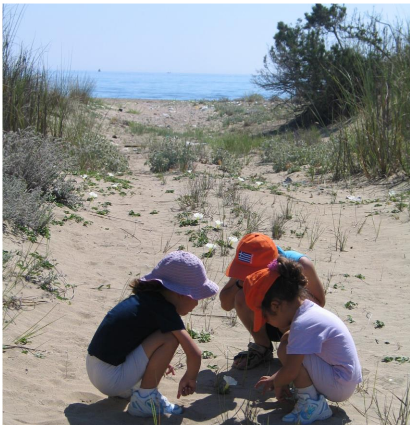
Εικ. 5: Σε 10 χρόνια λειτουργίας πάνω από 32,000 μαθητές έχουν συμμετάσχει στα προγράμματα περιβαλλοντικής εκπαίδευσης του ΚΥ.Κ.Π.Ε.Ε.