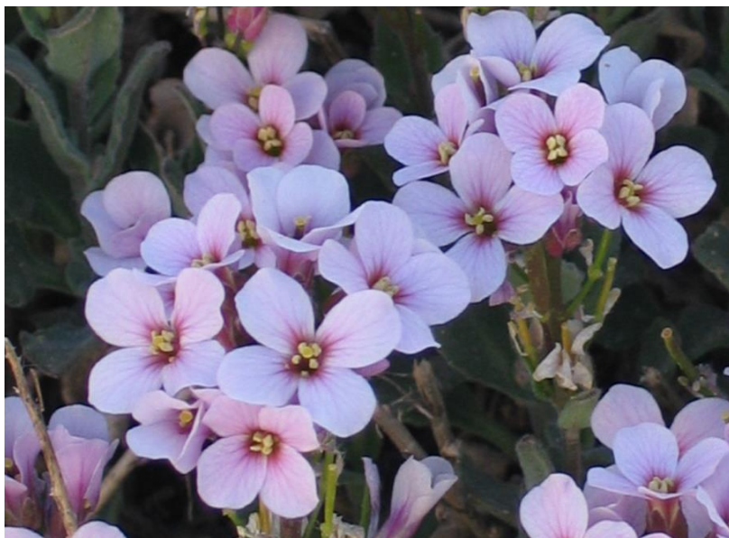
Εικ. 3: Τα δάκρυα της Παναγίας (Αραβίς η προροφυρή – Arabis purpurea ). Η ομορφιά και το κάλλος των φυτών είναι ένας δοξολογικός ύμνος προς τον Δημιουργό.