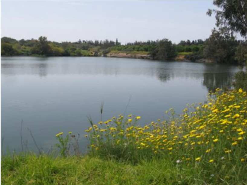
Εικ. 1: Ο ορθόδοξος χριστιανός ο οποίος αγαπά τη φύση είναι ευεργετικός, δραστήριος και ωφέλιμος για το περιβάλλον. Η Δεσποτική Λίμνη είναι ένας σημαντικός υγροβιότοπος διεθνούς σημασίας.