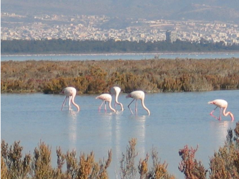
Εικ. 6: Σήμερα, όσο ποτέ άλλοτε, είναι ανάγκη να ενισχύσουμε την κατανόηση των βασικών οικολογικών συστημάτων και βιοκοινοτήτων του πλανήτη μας (Αλυκή Αζρωτηρίου).